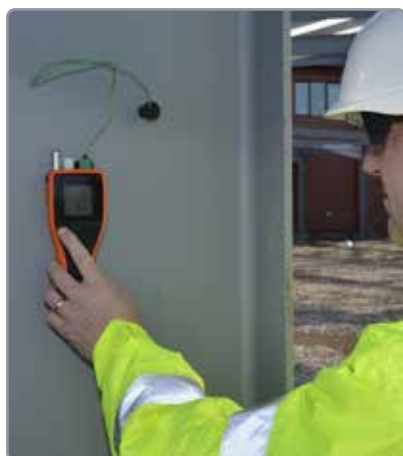
Impermeable y resistente a IP66