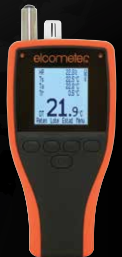
Elcometer 319 Medidor de punto de rocío