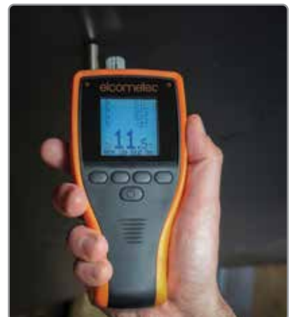
A prueba de polvo e impermeable con sensores completamente sellados (equivalente a IP66)