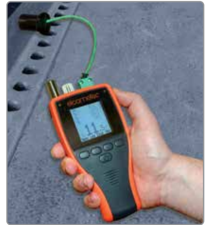
Estructura de menús intuitiva, multilingüe, fácil de usar

Conecte el Elcometer 319 mediante Bluetooth® o USB a un PC, dispositivo Android™ o iOS y descargue los datos a una aplicación de inspección o a ElcoMaster® para generar informes al instante.