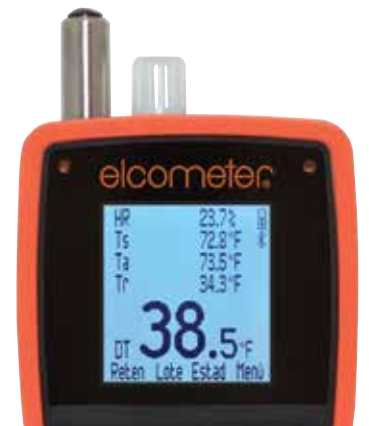
Ver hasta 5 estadísticas en pantalla seleccionables por el usuario