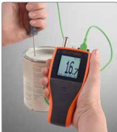
Te - ideal para el uso como un termómetro simple