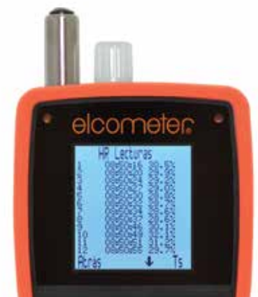
Revise las lecturas individuales

El Elcometer 319 puede utilizarse como medidor de punto de rocío de mano o como monitor de registro de datos remoto 2