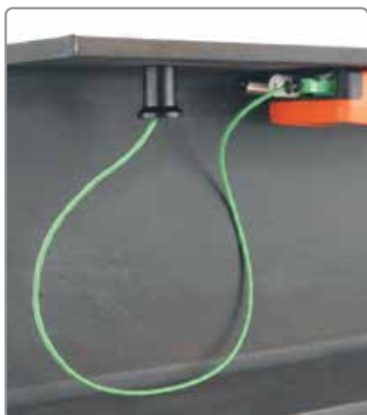
Monitorización remota de los parámetros climáticos