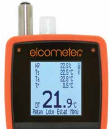
Mediciones grandes y fáciles de leer las en grados °C o °F

BS 7079-B4, IMO MSC.215(82), IMO MSC.244(83), ISO 8502-4, US Navy NSI 009-32, US Navy PPI 63101-000