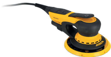
Mirka® DEROS II 650 150 mm

Compatible con Mirka® DEROS II 650 y Mirka® AIROS 650 para optimizar los flujos de trabajo.