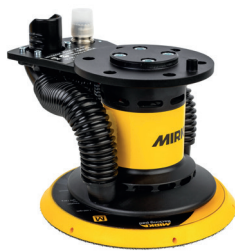
Mirka® AIROS 650S 150 mm